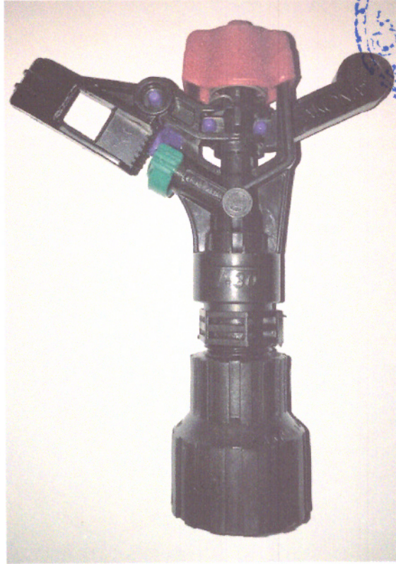
AKONA Tek Memeli Döner Yağmurlama Başlığı (T-30)