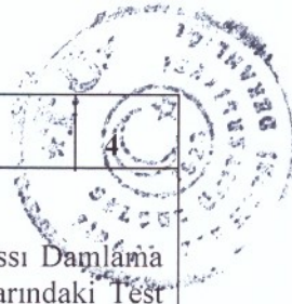
Çizelge 1. 1 Bar İşletme Basıncı ve 1,6 L/h Debili Damlatıcılı 17 mm Dış Çapındaki Yassı Damlama Sulama Borusunun Eğimsiz Düzlemde Değişik Damlatıcı Aralıkları ve Boru Et Kalınlıklarındaki Test Sonuçları